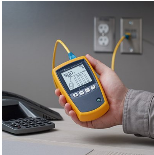
그림 5. The MicroScanner PoE is Ethernet Alliance Gen2 PoE certified and can detect the power offered by the PSE plus the network's speed, and features a suite of cable testing features.