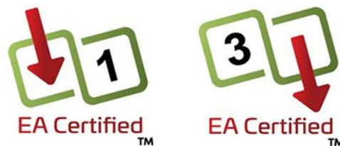
그림 3. Ethernet Alliance 마크: 전원 공급을 받는 장치(좌측) 및 전력 공급 장치(우측).

PoE 장비 설계자나 설치자는 간단하게 PSE와 PD에 있는 마크를 비교하여 호환성을 결정할 수 있습니다. PSE의 등급이 PD의 요건과 같거나 높은 경우, 기능이 보장됩니다.